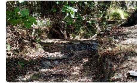
Completed micro-dams ready to receive water Author: Mediterranean Institute for Nature and Anthropos, and Kytherian Foundation for Culture & Development | © Educational use, non-commercial.