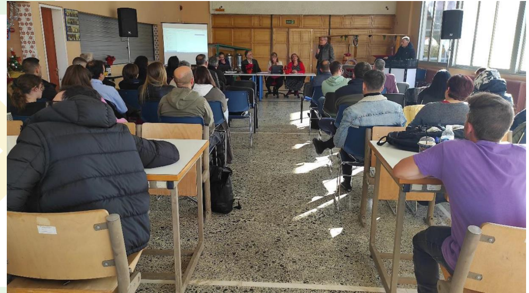
Νεμέα ημερίδα, 07/12/2023