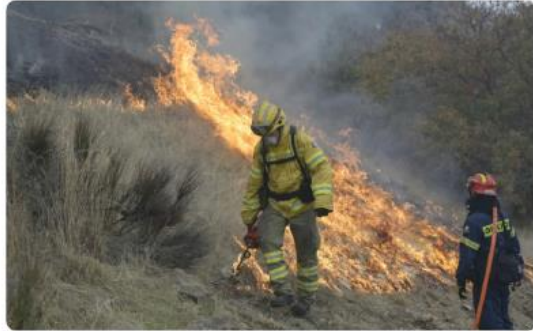
Conducting a prescribed burn in a fuel break.