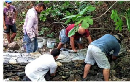
Construction of a micro-dam with local stones, near Karavas village on the island of Kythira, Greece

Revival of a traditional flood control practice to deal with water shortages in small Greek islands.