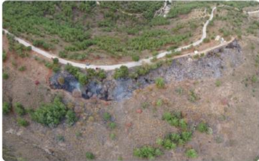
Treating and extending a shaded fuel break with prescribed burning.

A pilot project on prescribed burning in Greece to introduce the use of fire as a tool for forest fuel management and to improve social and ecological resilience of natural ecosystems.